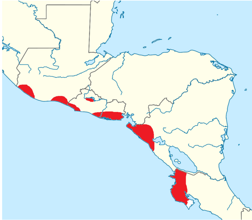
Figura 1 – Regiones en donde se ha documentado la presencia de la nefropatía mesoamericana.

recomendaciones sobre las áreas y las prioridades en investigación.